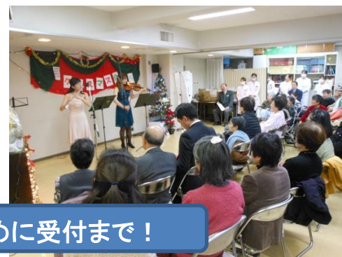
これまでのクリスマス会写真より